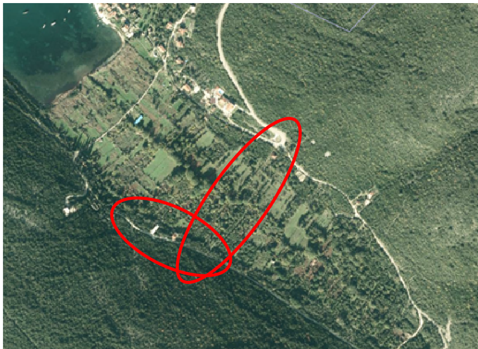
Lokacija planirane pristupne saobraćajnice

Izabrana lokacija obuhvata područje od krivine postojeće saobraćajnice 2811 KO Glavatičići do spoja sa postojećim makadamskim putem 2809/4 KO Glavatičići. Početna dionica obuhvata područje paralelno liniji obale uvale a krajnja dionica se poklapa sa trasom postojećeg makadamskog puta 2809/4 KO Glavatičići.