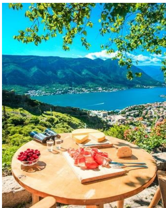
Pogled iz sela Špiljari

Turizam kao pokretač crnogorske ekonomije predstavlja značajno tržište za domaće proizvode. Tradicionalni proizvodi visokog kvaliteta (organski proizvodi) dopuniće turističku ponudu, a povezivanje poljoprivrede i turizma ogleda se i u razvoju seoskog turizma.