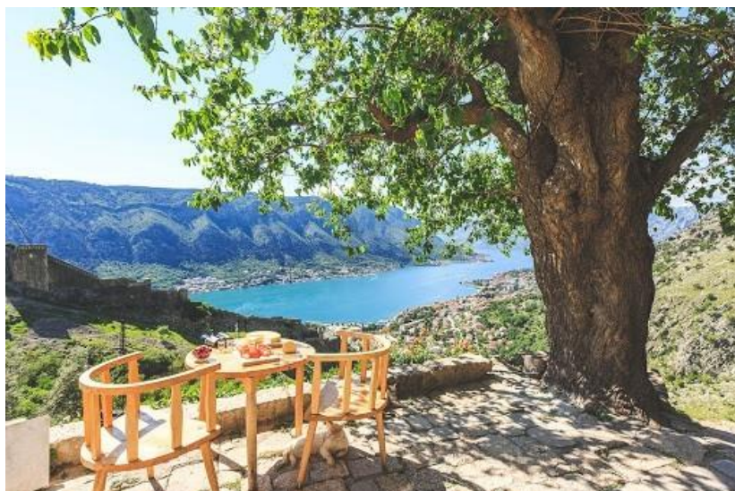
Pogled iz sela Špiljari

Bogatstvo prirodnog i kulturnog nasljeđa Crne Gore u njenim ruralnim područjima probudilo je interes turističke tražnje za nečim novim i autentičnim. Sve veći broj turista teži zdravom načinu života, uživanju u prirodi, očuvanim običajima i drugim autentičnim iskustvima.