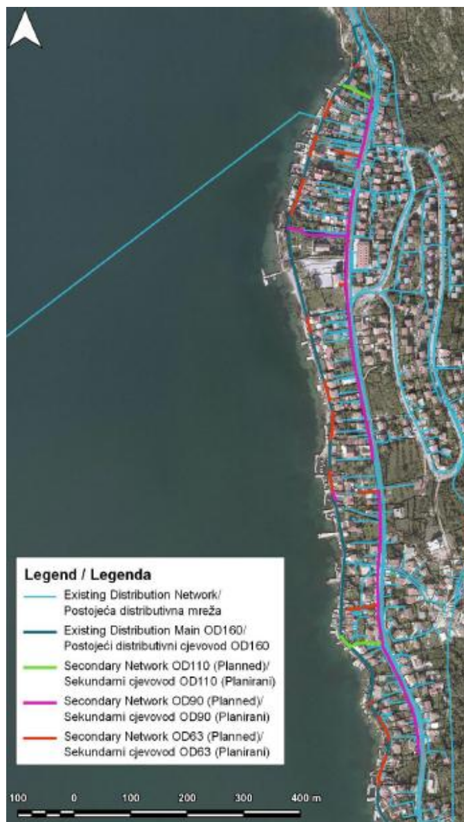
Slika 4. Situacioni plan projekta

Situacioni plan projekta dat je na slici 4.