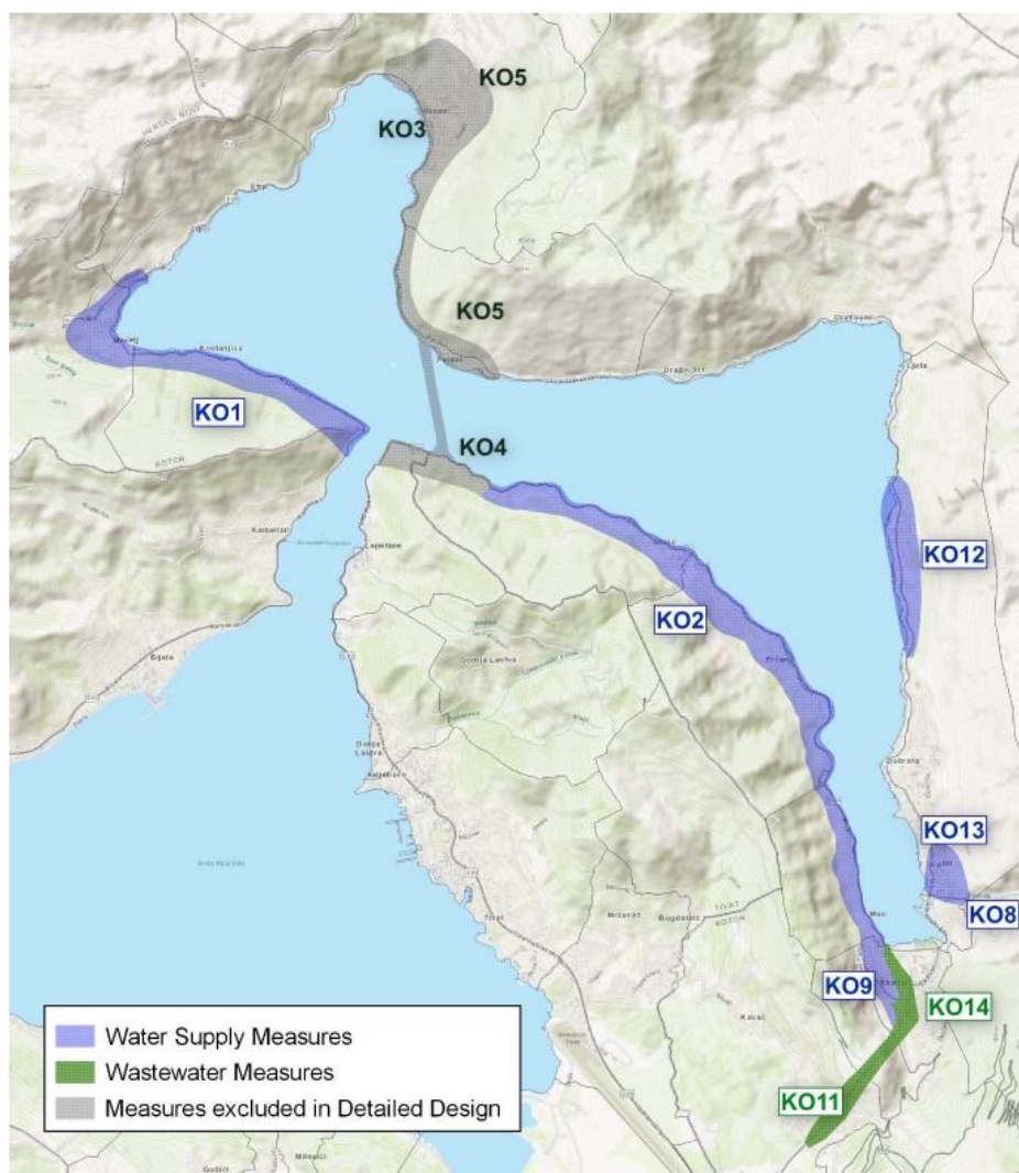
Slika 2. Projektno područje - Mapa sa lokacijama projekata u Opštini Kotor

Projektno područje - Mapa sa lokacijama projekata u Opštini Kotor prikazana je na slici 2.