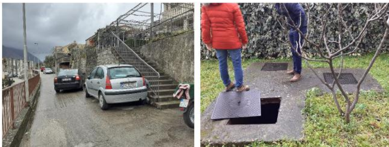
Slika 7. Pristup parceli sa puta i izgled postojećeg šahta

Pristup parceli sa puta i izgled postojećeg šahta prikazan je na slici 7.