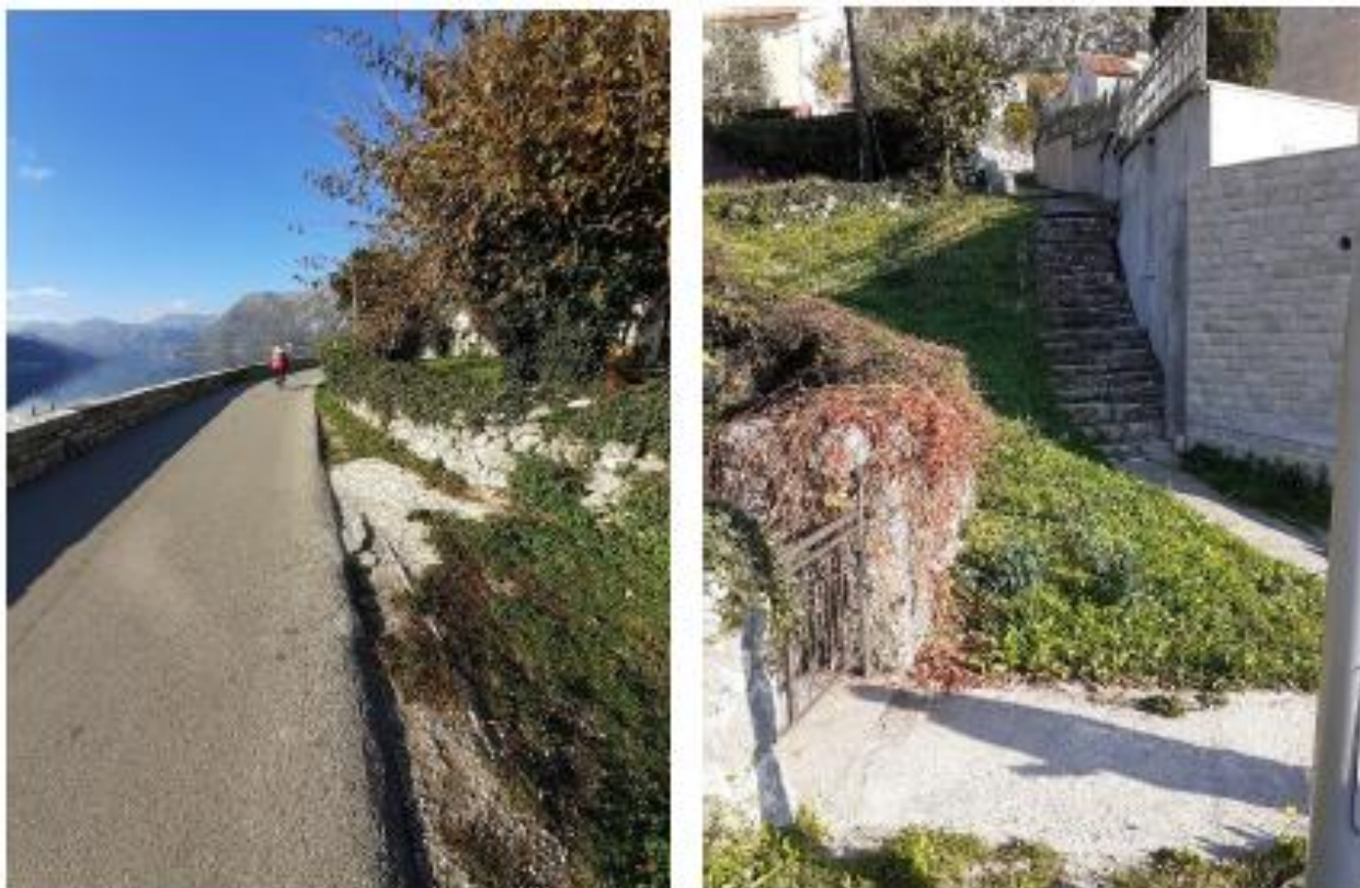
Slika 5. Izgled ulica u koje će se polagati cjevovod

Izgled ulica u koje će se polagati cjevovod prikazan je na slici 5.