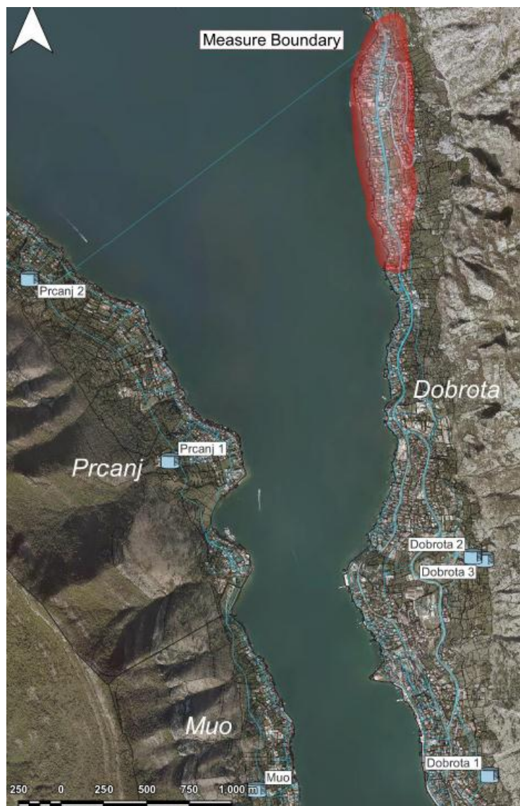
Slika 3. Pregled postojeće vodovodne infrastrukture

Pregled postojeće vodovodne infrastrukture prikazan je na slici 3.